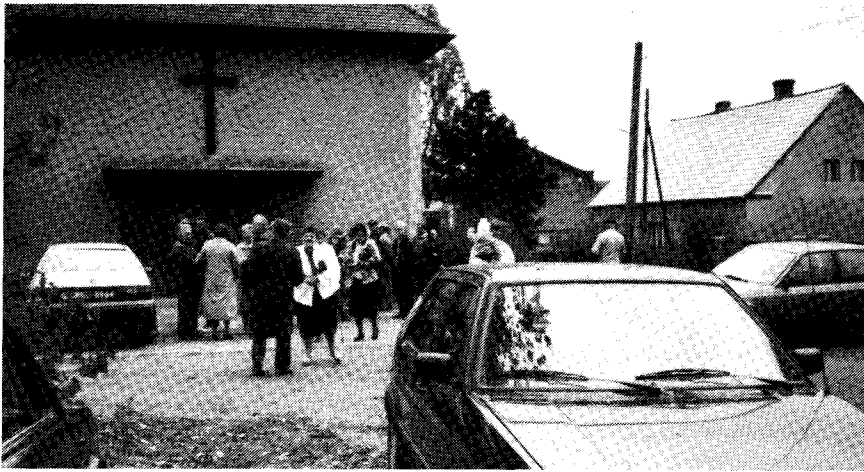
Nach dem Gottesdienst vor der Kirche