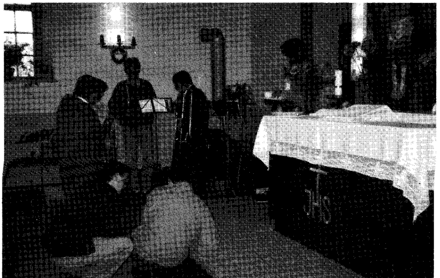
Die Gruppe der Posaunenbläser bei der Vorbereitung für den Gottesdienst

Am Sonntag, dem 11. 10. 1992 trafen wir uns schon um 8.30 Uhr in der festlich geschmückten Kirche in Neurode zu einer ausführlichen Probe. Nach und nach füllten sich die Kirchenbänke und um 10 Uhr begann dann der Festgottesdienst mit einem Bläserstück von G.F. Händel.