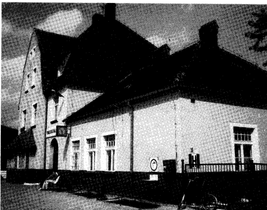
Unverändert: Der Festenberger Bahnhof im Jahr 1991