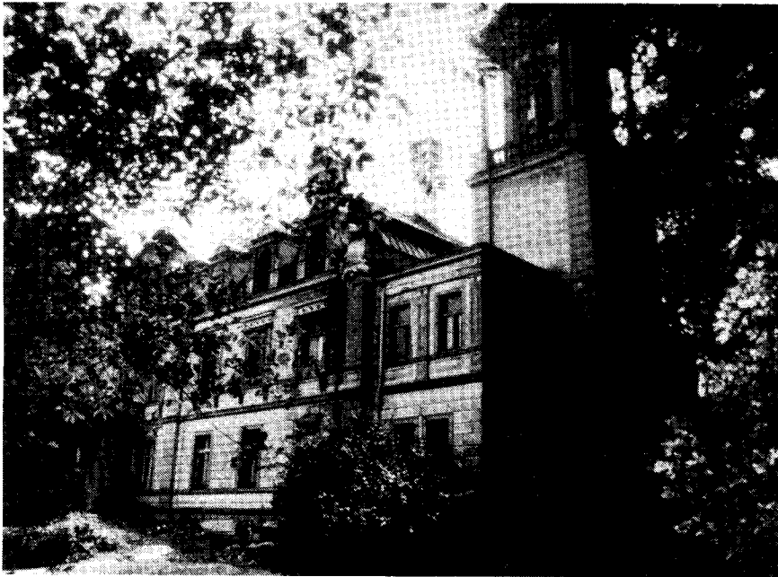
Das Schloß des Landrats von Reinersdorf wird restauriert.

chen Försterei in Schleise (Förster Groschke verwaltete diese bis zur Vertreibung) sind nur noch Mauerreste zu sehen. Die Suche nach Blaubeeren war allerdings erfolgreich; der Beerengeschmack hat sich nicht verändert. Unverändert auch die sandigen Forstwege. Zur frohen Stimmung trugen auch die