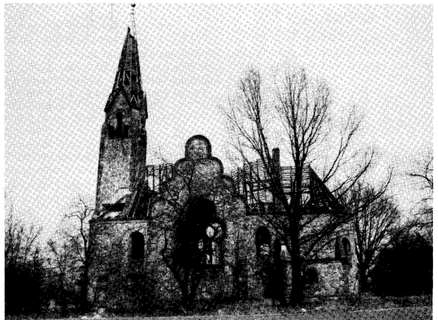
Prinz-Wilhelm-Gedächtnis-Kirche in Schreibersdorf. (Foto: H. Koni, Ostern 1991)

Arnold Hertmann-Berlin bauen. Am 16. Dezember 1902 erfolgte die Einweihung. Das schöne Gotteshaus (auf dem Foto noch in etwa erkennbar) erhielt den Namen „Prinz-Wilhelm-Gedächtniskirche“. Erster Pastor der neuen Kirchengemeinde wurde der langjährige Erzieher des verstorbenen Erbprinzen, Ernst Krause. Herbert Pietzonka