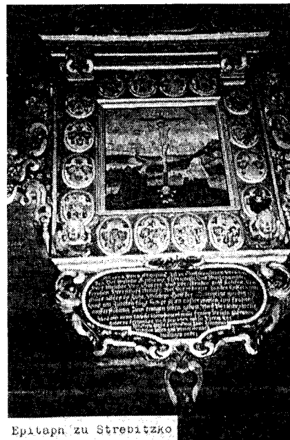
Epitaph zu Strebitzko

Unser Wirt und Begleiter allerdings war solange deutsch, bis man alle zu Polen machte. Sein Vater fiel als deutscher Soldat. Er selbst war wie ich auch beim Schanzeneinsatz und damals hat er weder ein Wort polnisch verstanden, geschweige denn gesprochen. Als man dann die Deutschen zur Deportation schon auf Lastkraftwagen getrieben hatte, merkten die Polen, daß sie auch Arbeiter brauchten. Alle Männer mußten also wieder absteigen. Auf diese Weise wurde er zum Bergarbeiter. Endlich konnte er doch noch zur Schule gehen. Daß er es sogar noch bis zum Baumeister schaffte, zeugt von seiner Tüchtigkeit. Als solcher kam er dann nach Kraschnitz, wo er seine Frau heiratete. Deren Eltern aber waren aus Ostpolen, wel-