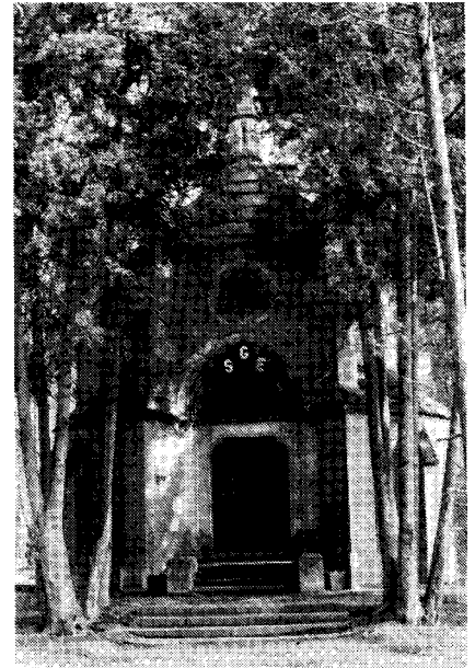
Das restaurierte prinzliche Mausoleum (Ostern 1991)

den Guts- und Gemeindebezirken Schreibersdorf, Baldowitz, Mangschütz und Märzdorf mit ungefähr 1500 Seelen. Die frühere Oberförsterei in Baldowitz wurde Pfarrei. Zur Erinnerung an seinen 1899 verstorbenen Sohn aus erster Ehe, Erbprinz Wilhelm, ließ der Standesherr eine Kirche in rotem Main sandstein nach den Plänen des Architekten