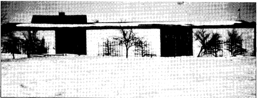
Die zum Waldgut Knopke gehörenden Gebäude (Remisen) im Winter 1938/39.