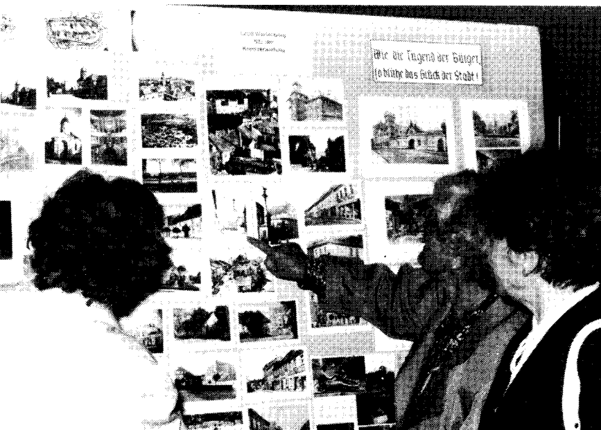
Sonderausstellung Groß Wartenberg im Museum