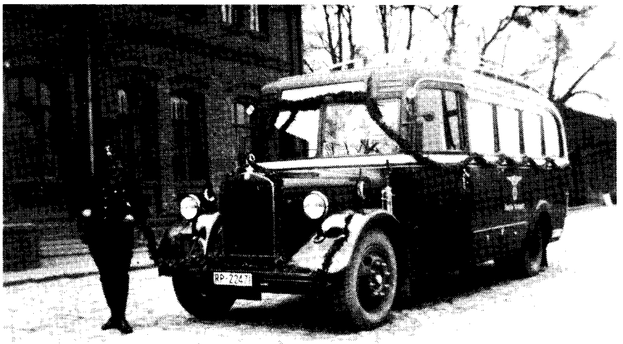
Postbus vor der alten Volksschule am Oberring in Festenberg.