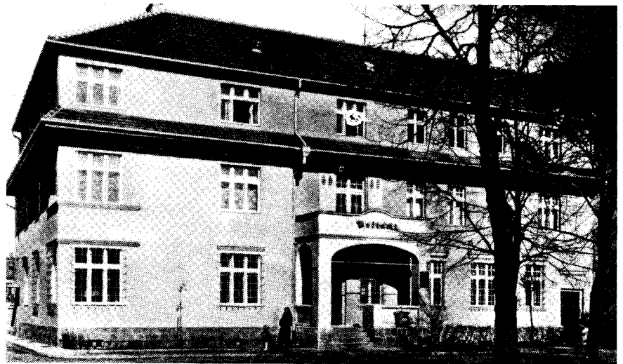
Das Festenberger Postamt am Oberring

Der Verlag DAS BESTE GmbH ist seit fast 4 Jahrzehnten in Stuttgart ansässig und das deutsche Tochterunternehmen des Reader's Digest.