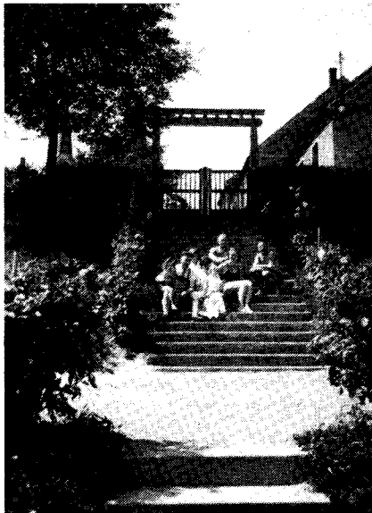
Das einladend angelegte Portal zur Stauanlage in Festenberg, etwa 1935.