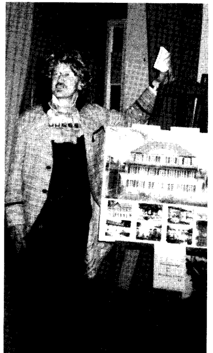
Besuch aus Rinteln beim Treffen. Er wollte einen schlesischen Stadtschreiber darstellen.