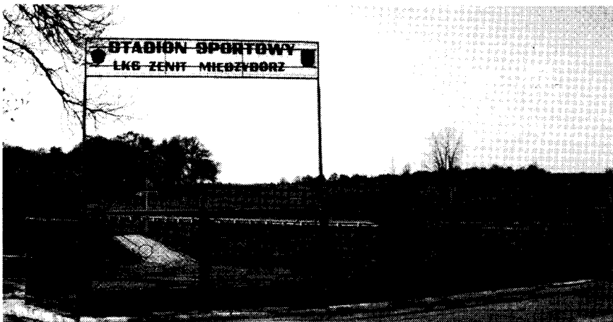
Stadion Sportowy (Sport-Stadion) – (LKS Ludowa Klub Sportowy) Zenit Miedzyborz (Volks-sport-Klub „Zenit“ Miedzyborz). – Im Hintergrund links die Bäume des Friedhofs.