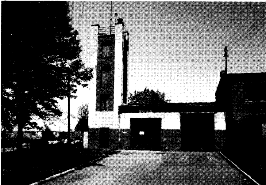
Das Feuerwehrhaus mit Übungsturm steht heute noch.