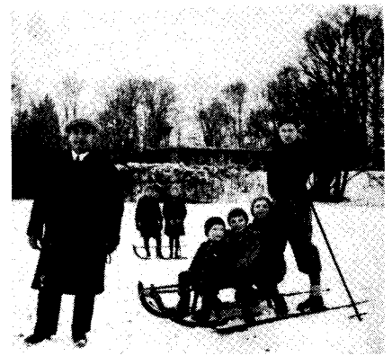
Rodeln auf dem Eulenhügel. Im Hintergrund sieht man die Veranda im Schloßgarten des prinz. Biron von Curlandschen Schlosses.