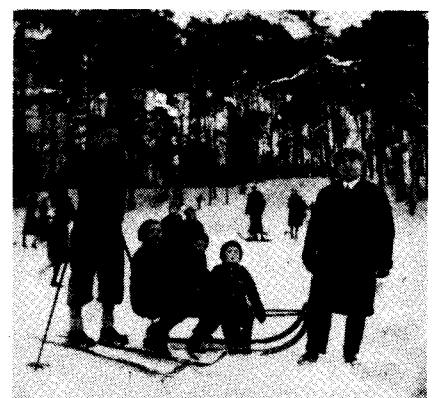
Alt und jung vergnügten sich bei guten Schneeverhältnissen im Schloßpark von Groß Wartenberg.