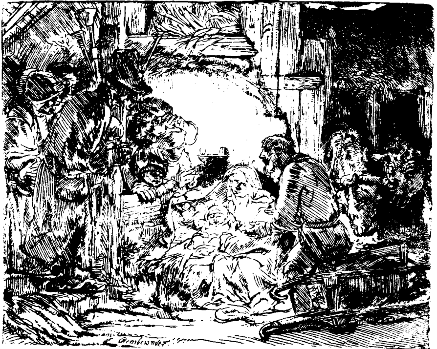
Anbetung der Hirten (Radierung von Rembrandt van Rijn, um 1654).