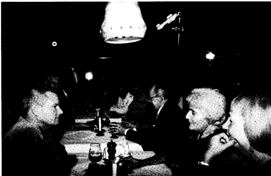
Neumittelwalder im Hotel „Zum Brückentor“

Die Geschichte des Briefmarken-Hin- und-Hers begann 1948. Damals befahl die sowjetische Kommandatur in Ost-Berlin, die in West-Sektoren verbreiteten Posthorn-Wertzeichen nicht zuzulassen. Auf west-deutscher Seite wurden später DDR-Sen-