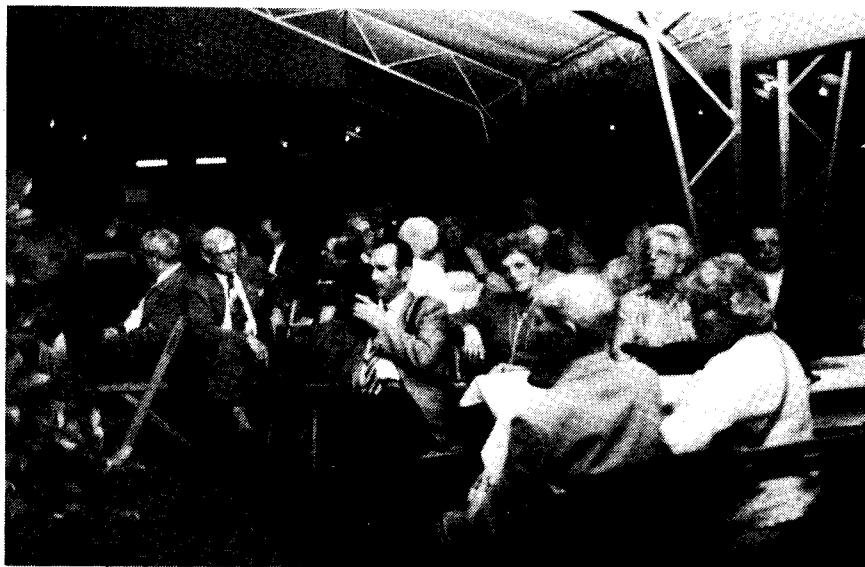
Eine Gruppe Groß Wartenberger

Weitere Berichte und Bilder erscheinen in der nächsten Ausgabe des Heimatblattes. DIE REDAKTION