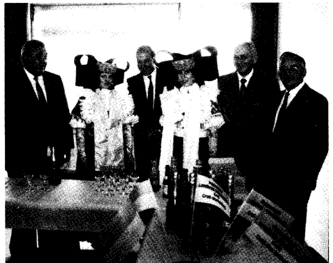
Zwei Frauen in Schaumburger Tracht bewirteten die zum Empfang geladenen Gäste