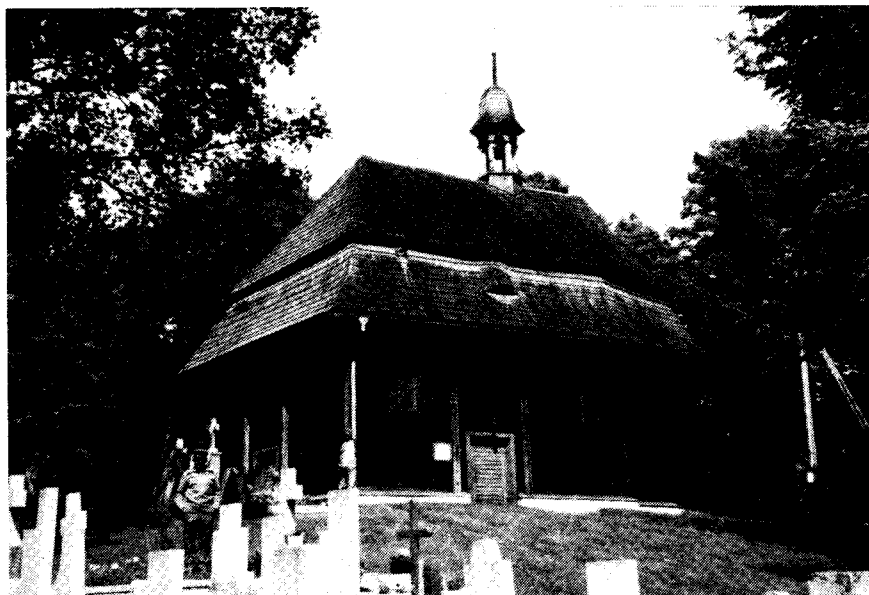
Von Landsmann Erich Sperling, Sternenweg 3, 4950 Minden, früher Mühlenort, kommt diese schöne Aufnahme der Kapelle auf dem Markusberg bei Groß Wartenberg.

Der Oktober-Ausgabe liegt ein Prospekt des Vereins Haus Schlesien bei. Für den weiteren Ausbau des „Haus Schlesien“ wird noch viel Geld nötig sein, damit es zu der repräsentativen Begegnungsstätte werden kann, gleichzeitig zum Mittelpunkt für alle Dinge und Angelegenheiten, die unser Schlesien betreffen.