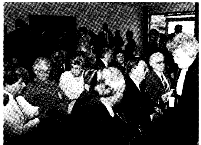
Zum Empfang geladene Gäste