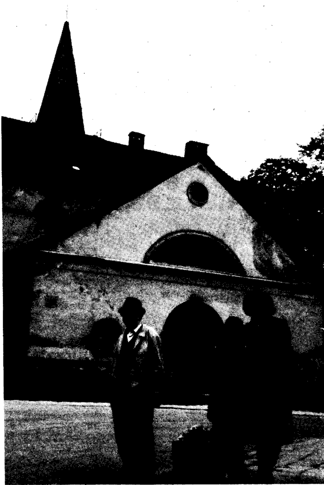
Ein Bild des Verfalls bietet die evangelische Kirche in Neumittelwalde, vor deren Nordseite sich Oswald Eckert mit seinen Angehörigen fotografieren ließ.