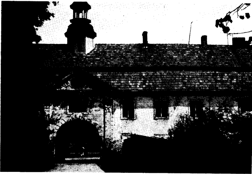
Eingang zum Schloßhof in Goschütz.