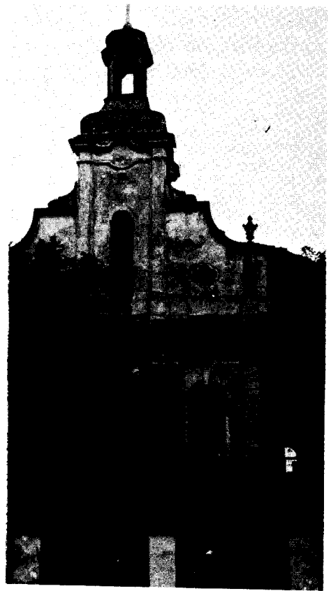
Ruine der Schloßkirche Goschütz