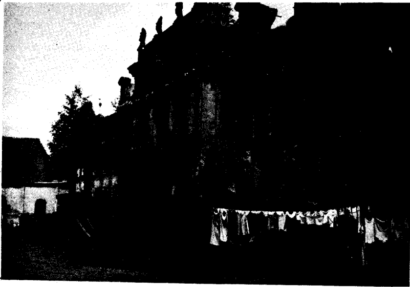
Vorderansicht vom Schloßhof aus gesehen.