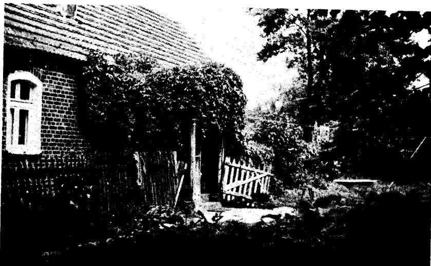
Die Försterei Lindenhorst (Domaslawitz), früher Revierförster Emil Bruß, zeigt deutliche Zeichen der Verwahrlosung. Dem Backsteinbau und dem Dach sieht man die alte handwerkliche Wertarbeit heute noch an.